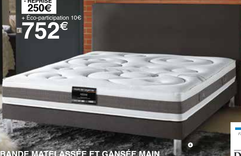
PLATE BANDE MATELASSÉE ET GANSÉE MAIN