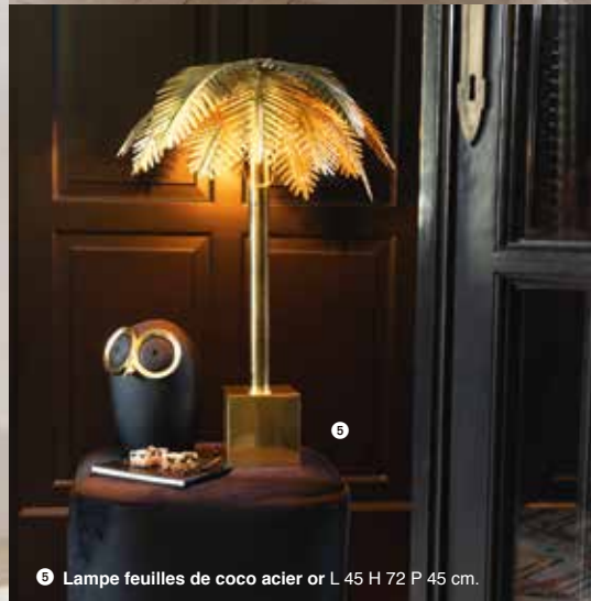
6 Lampe feuilles de coco acier or L 45 H 72 P 45 cm.